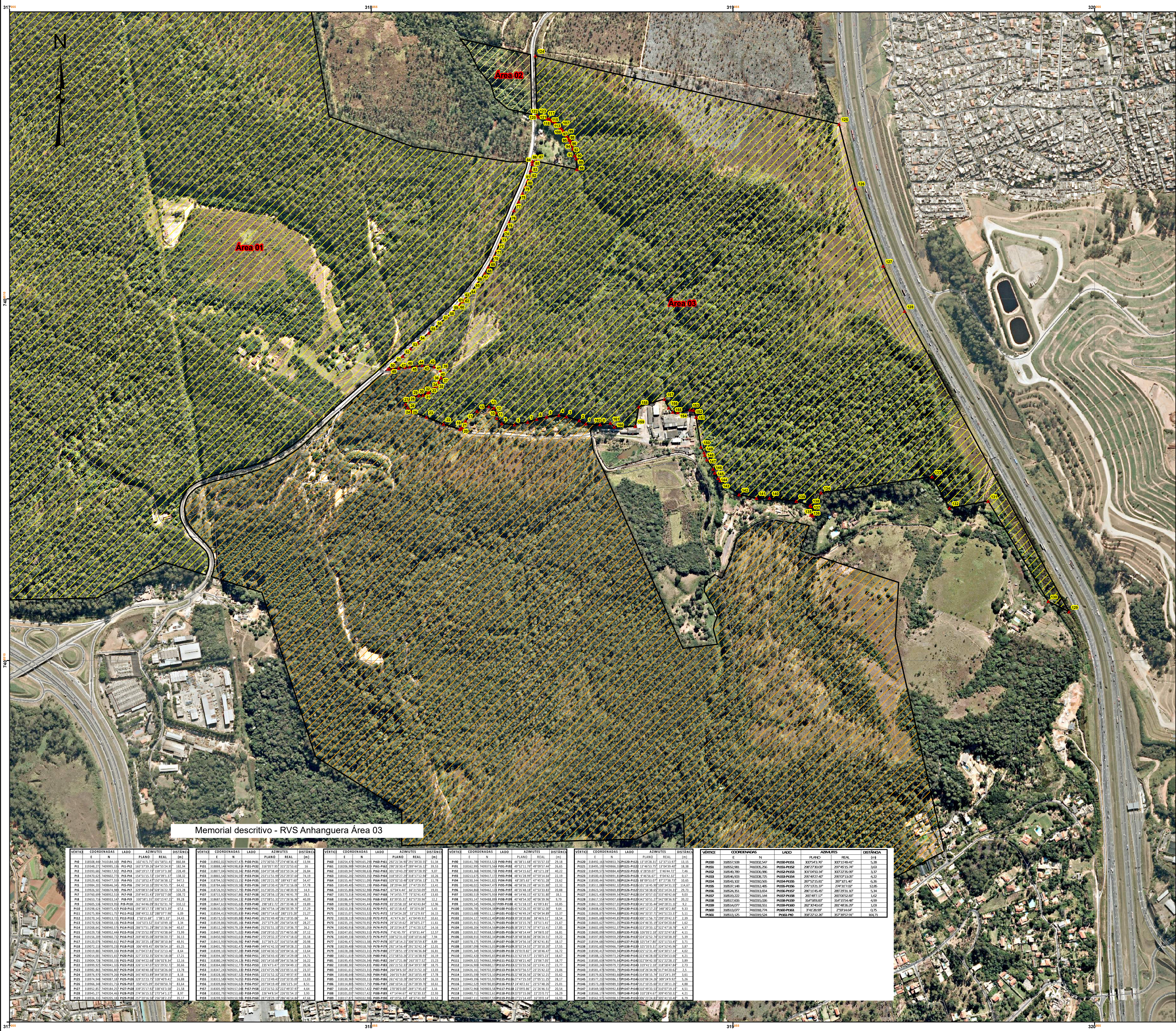
Memorial descritivo - RVS Anhanguera Área 03